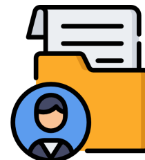
Таблица 1. Списочный состав учащихся

Заявка оформляется на бланке юридического лица и подписывается уполномоченным лицом. В заявке должна быть указана следующая информация: наименование программы/программ обучения, количество обучающихся; контактный телефон и адрес электронной почты ответственного лица; реквизиты организации или карта партнера; списочный состав учащихся (бланк опубликован на странице сайта https://rumb.plavsostav.ru/zachisleniye.html )